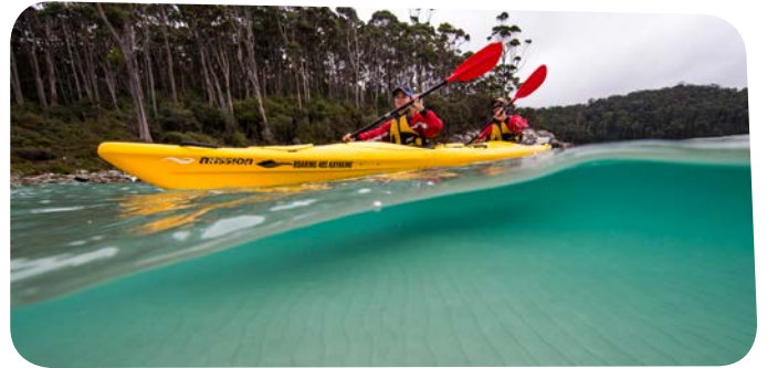
文艺体育活动之一，皮划艇

各个学校都开展广泛的文艺体育活动 (enrichment programs)，且这些活动均已包含在学费之内。课外活动有冲浪、团体运动和音乐。文艺体育活动倡导健康的学习和生活张弛有度，也为结交朋友提供了绝佳机会。我们根据各个学生的不同兴趣，为他们安排最适合的学校。